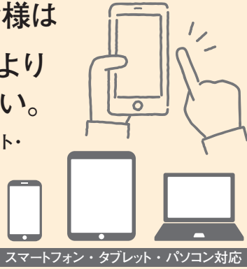
スマートフォン・タブレット・パソコン対応

スマートフォン・タブレット・ パソコン対応で、 クレジットカード・ コンビニ支払いなど 多彩な決済方法を 用意しています。