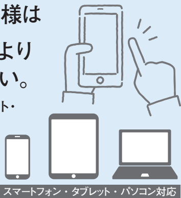
スマートフォン・タブレット・パソコン対応